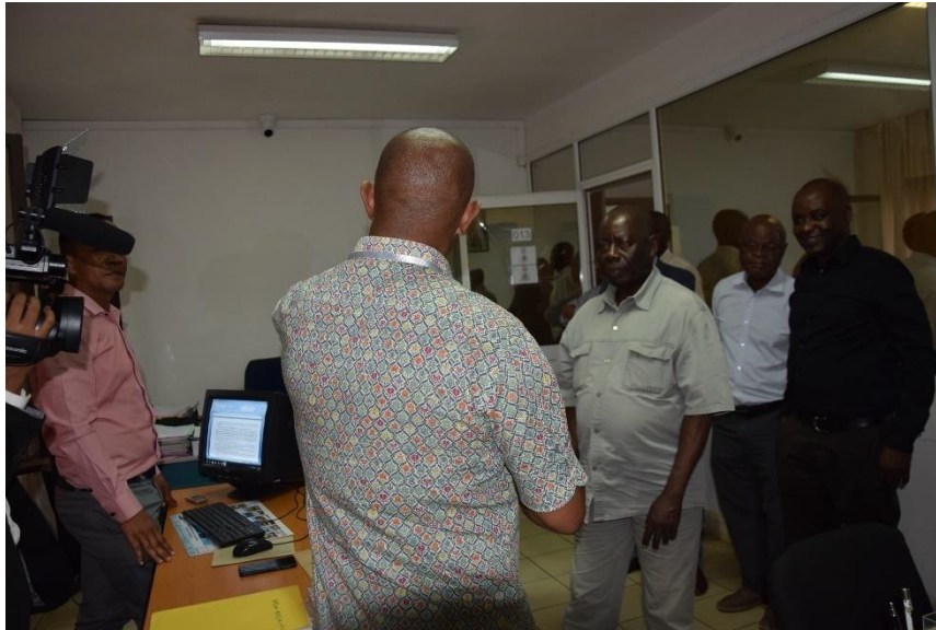
Les Membres du Comité Exécutif visitant la salle des investigations.