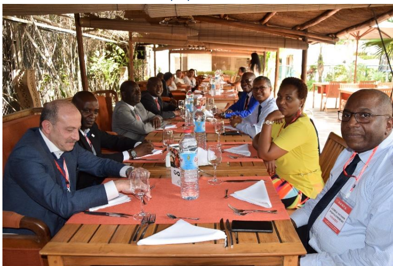
Les membres du Comité exécutif en pause déjeuner