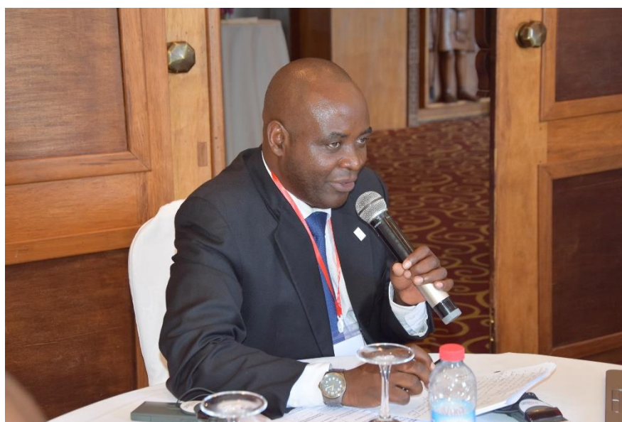
Le SG a.i. lors de son Intervention sur les élections

Le Secrétaire Général a.i a annoncé aux participants à la 7 ème réunion du Comité Exécutif que le mandat est de trois ans et que ce Comité Exécutif élu en 2017 termine son mandat en 2020 donc le nouveau CE sera élu au cours de la prochaine Assemblée Générale Annuelle prévue à Antananarivo au Madagascar en 2020.