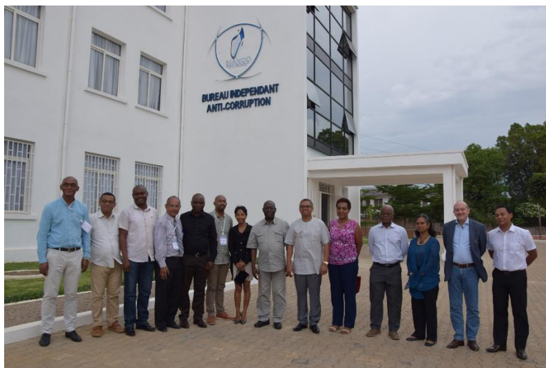
Les Membres du Comité Exécutif avec le personnel du BIANCO

Au cours de la 7 ème réunion du Comité Exécutif, les membres ont eu à visiter le siège du Bureau Indépendant Anti-Corruption/ Madagascar