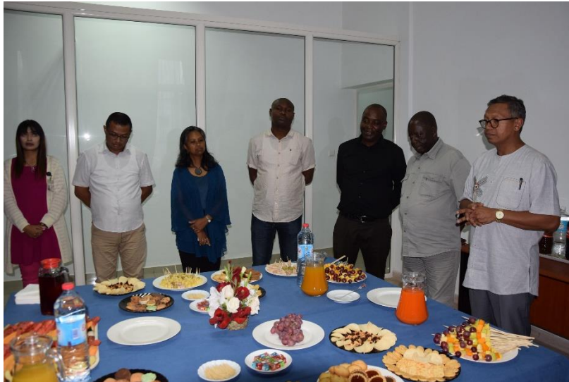
Le Directeur Général du BIANCO offrant un cocktail aux membres du Comité Exécutif au siège du BIANCO