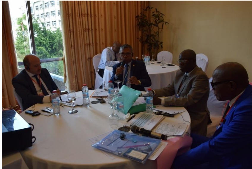
Les membres du Comité Exécutif lors de la 7 ème Réunion à Antananarivo/Madagascar