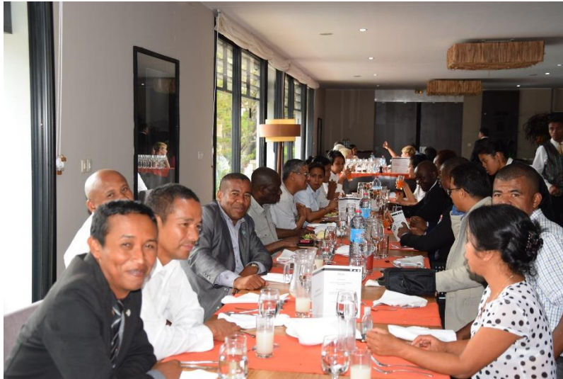
Le Personnel du BIANCO recevant les délégations du CCUAC et de l'AAACA dans un diner