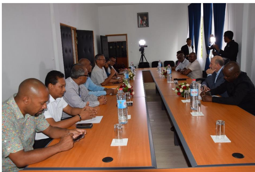
Les membres du Comité Exécutif de l'AAACA avec le personnel du BIANCO au Siège