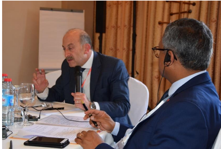
Gnl/ Khaled Abdelrahman lors de son intervention